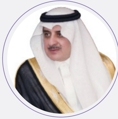
صاحب السمو الملكي الأمير فهد بن سلطان بن عبد العزيز آل سعود أمير منطقة تبوك